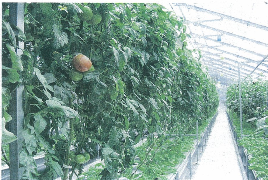
奥行き150m超の「ヤマネ式」循環養液栽培場。完全無農薬による通年安定生産はもちろんのこと、むずかしいとされる結球野菜の連続栽培も実現している

社会の活力維持には少子・高齢化も大きな問題。消費者・就労者・納税者が減少し、高齢者の比率が高まる社会は健全に循環し得ない。06年12月に発表された国立社会保障・人口問題研究所中位推計