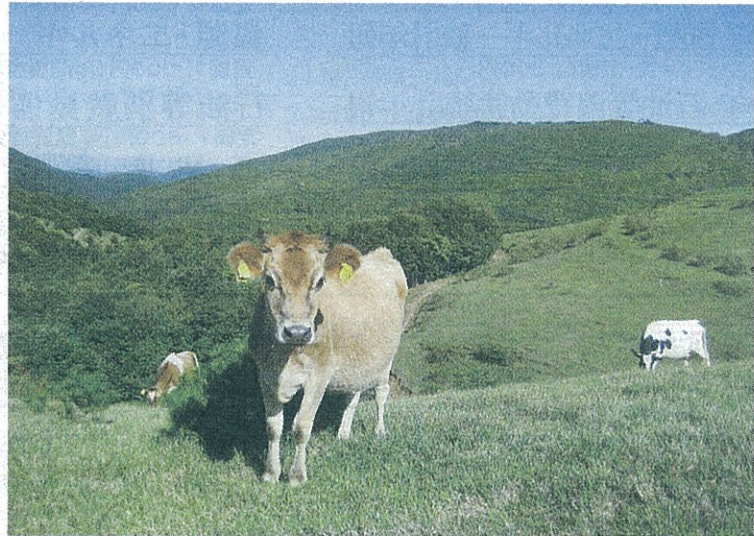
「中洞式」森林酪農の特徴は通年昼夜放牧。自然交配・自然分娩・自然哺乳で育つウシは搾乳時を除き、自然びりと山野で過ごす